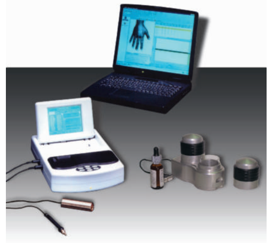
B.E.S.T.-System zur EAP-Testung und Signalübertragung (nah und fern).

Einen quantitativen, der im wissenschaftlichen Sinne wäg- und meßbar ist und einen qualitativen, der von der Bewertung und Bedeutung abhängt, die ihm eine bestimmte Person oder Gemeinschaft „zuschreibt“. Beide Aspekte werden simultan verarbeitet, so daß wir uns einerseits im konkreten, äußeren Bereich und andererseits im abstrakten, inneren Bereich befinden. Alles in Allem jedoch Vorgänge, die meistens völlig unbewußt ablaufen und über die wir uns deshalb auch kaum Gedanken machen.