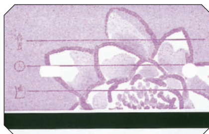
Moderne Informationstherapie - die SI Card mit Magnetstreifen. Wird umgehängt getragen oder an bestimmten Körperstellen mittels Pflaster befestigt.

Neben diesen klassischen anwenderbedingten Methoden, deren Funktionsweise ohne wenn und aber als bewußtseinsrelevant dargestellt wird, gibt es jedoch noch eine ganze Reihe anderer psychobiophysikalischer Verfahren, die mit etwas mehr Elektronik und teilweise auch aktiven physikalischen Komponenten ausgestattet sind. Laut Angaben einiger Hersteller sollen sie nach wissenschaftlichen Gesetzmäßigkeiten ausgerichtet und nach physikalischen Prinzipien funktionieren. Darunter fallen in erster Linie alle instrumentellen Verfahren, die mit sogenannten patienteneigenen Schwingungen arbeiten, bekannt auch als Mora- oder Bioresonanztherapien.